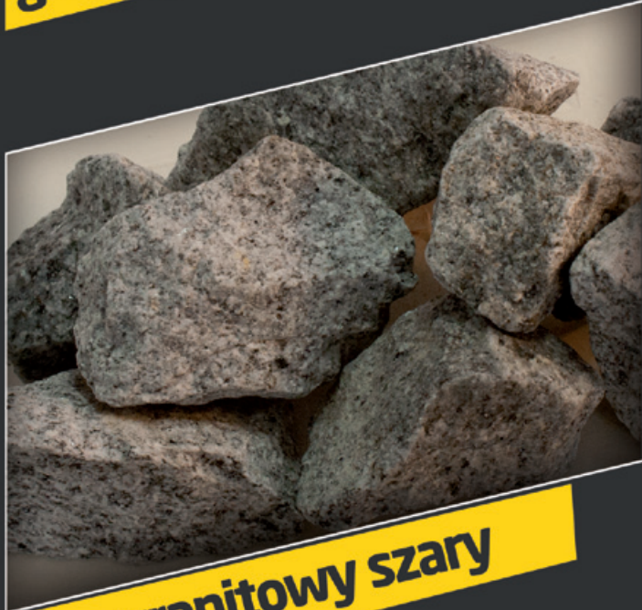
głaz granitowy szary